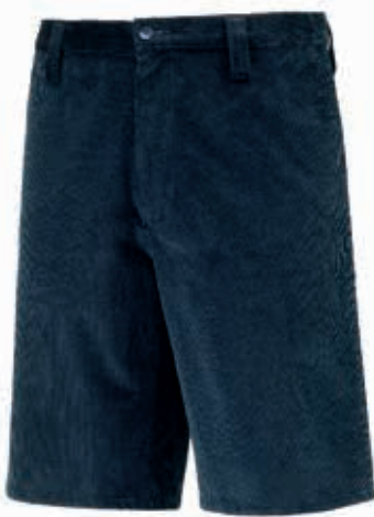
PANTALONE CORTO UNISEX VELLUTO