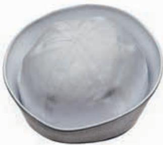
BERRETTO SCOUT NAUTICO