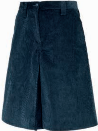
GONNA PANTALONE VELLUTO