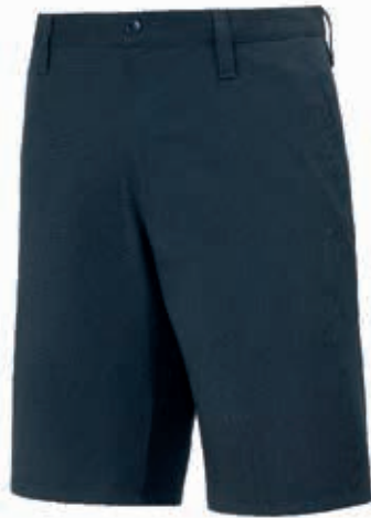
PANTALONE CORTO UNISEX GABARDINE