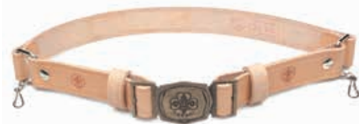
CINTURA IN CUIOIO CON FIBBIA