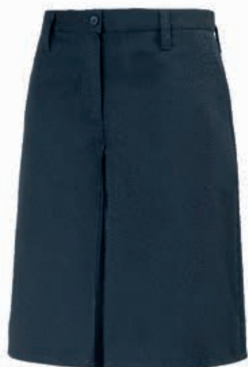
GONNA PANTALONE GABARDINE

L'uniforme costituisce un legame di fraternità tra gli scout di tutto il mondo e viene indossata dagli associati così come indicato nel Regolamento AGESCI.