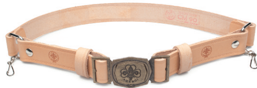
CINTURA IN CUIOIO CON FIBBIA