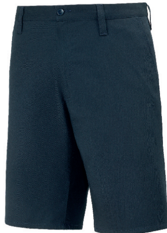
PANTALONE CORTO UNISEX GABARDINE