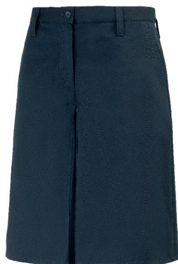
GONNA PANTALONE GABARDINE

L'uniforme costituisce un legame di fraternità tra gli scout di tutto il mondo e viene indossata dagli associati così come indicato nel Regolamento AGESCI.