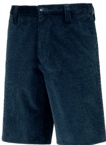
PANTALONE CORTO UNISEX VELLUTO