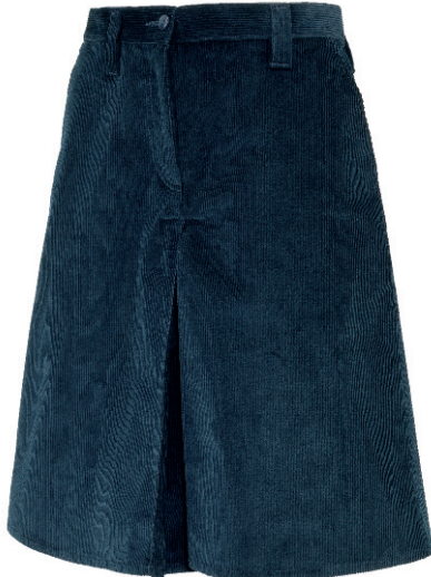
GONNA PANTALONE VELLUTO