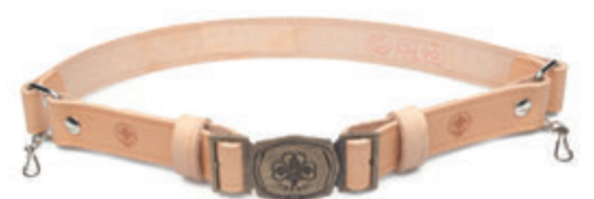
CINTURA IN CUOIO CON FIBBIA