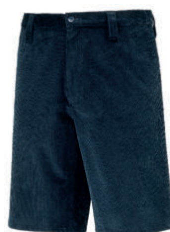
PANTALONE CORTO UNISEX VELLUTO