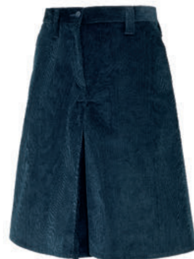
GONNA PANTALONE VELLUTO