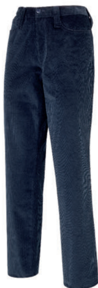
PANTALONE LUNGO UNISEX VELLUTO