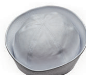
BERRETTO SCOUT NAUTICO