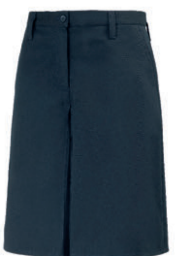
GONNA PANTALONE GABARDINE

inquadra il QR CODE e scopri tutti i dettagli e la tabella taglie dell'uniforme