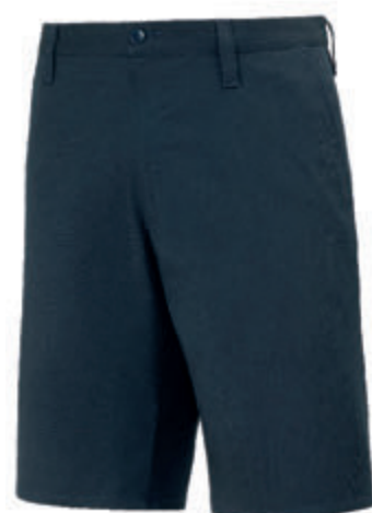
PANTALONE CORTO UNISEX GABARDINE